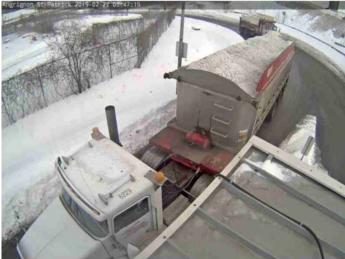
Transport de neige effectué par Entreprise Sylvain Choquette inc. le 22 février 2019.