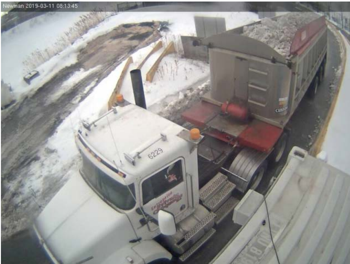
Transport de neige effectué par Entreprise Sylvain Choquette inc. le 11 mars 2019. Photo remise par le SCA au Bureau de l'inspecteur général.