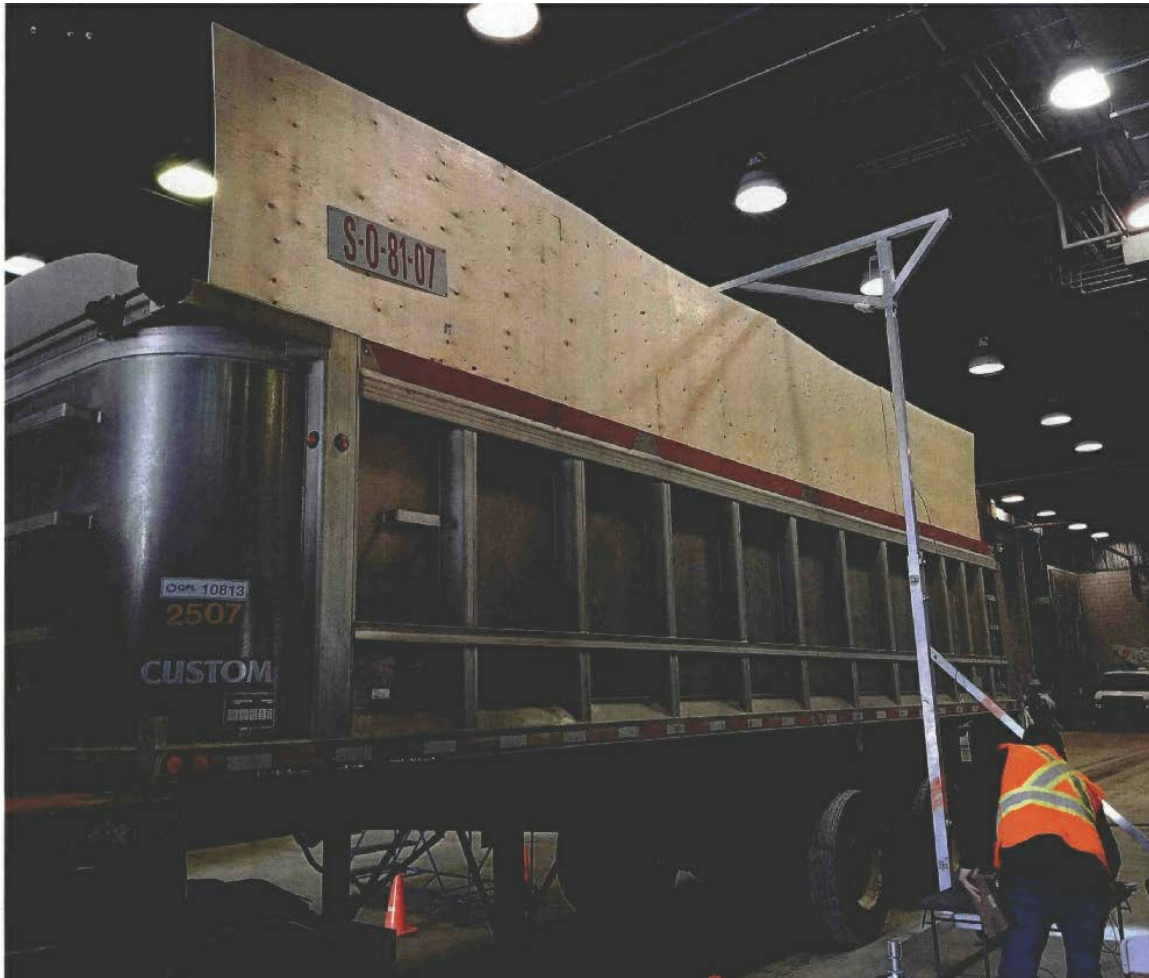
Photo prise de l'extérieur de la benne du camion d'Entreprise Sylvain Choquette inc. lors de la séance de mesurage du 9 mars 2019.